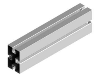
Perfil compatible G7

Par de apriete Tornillo M8 Hexagonal 20 Nm